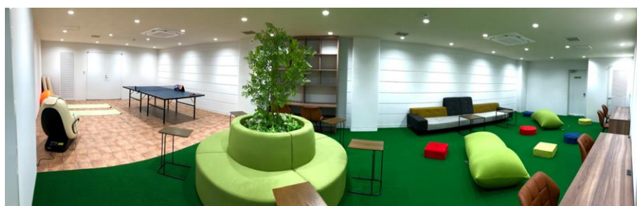
▲入居者専用リビングルーム