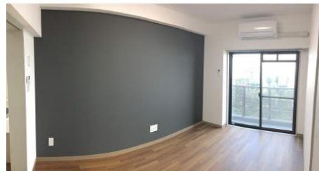
▲全居室にブラックボード設置。

住所：東京都世田谷区玉川 交通：東急田園都市線・大井町線「二子玉川」駅徒歩6分 構造：鉄筋コンクリート造地上4階 地下1階 コンセプト：ITエンジニア/クリエイター向け 設置設備(共有部)：宅配ボックス/共有ウッドデッキテラス 共有ダイニングルーム/共有リビングルーム 総室数：31室+管理人室