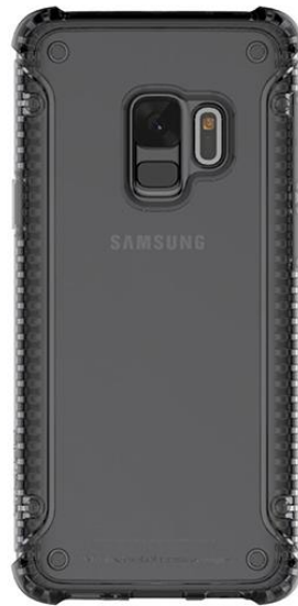
URABN GRAY (アーバングレー)