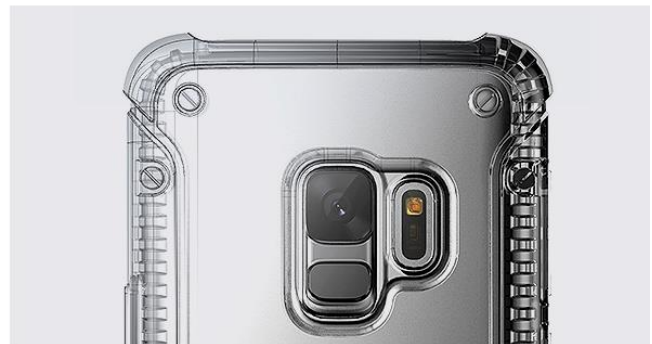
個性的なボルトデザインが衝撃を分散