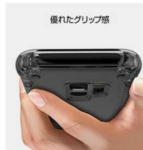
優れたグリップ感