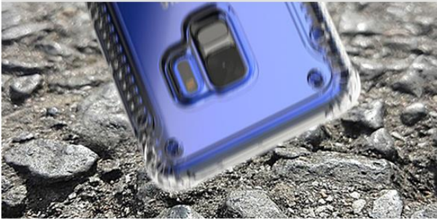
4つの角がクッションで衝撃吸収