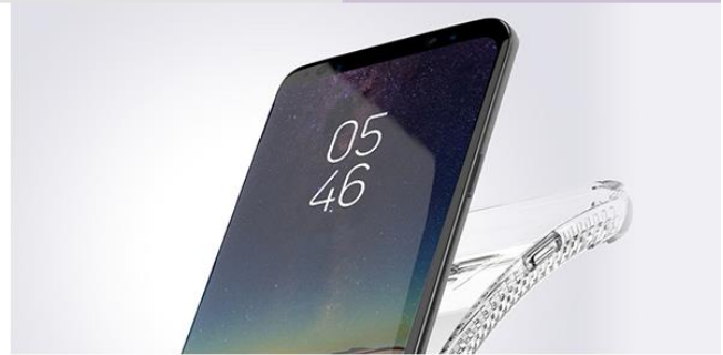
端末をしっかりサポート