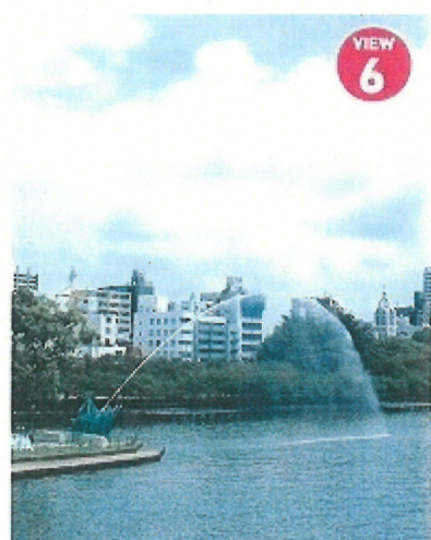
VIEW⑥ 剣先公園の大噴水