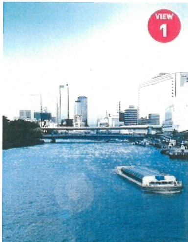
VIEW① 天満橋エリアの昼中（下流より撮影 / 奥・天満橋）