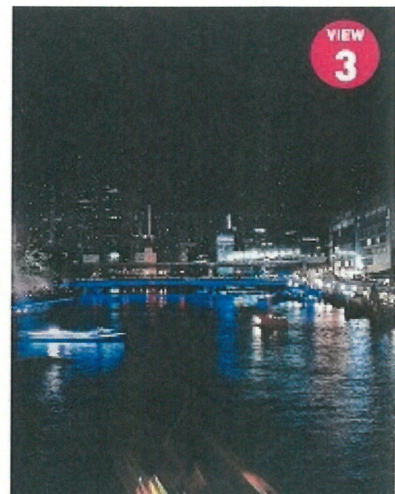
VIEW③ 天満橋エリアの夜景（下流より撮影 / 奥・天満橋）