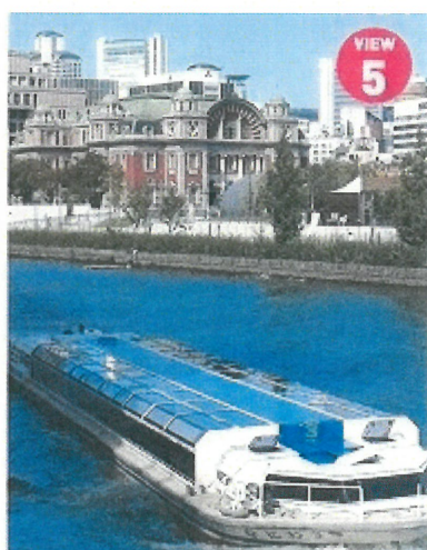
VIEW⑤ 大阪市中央公会堂