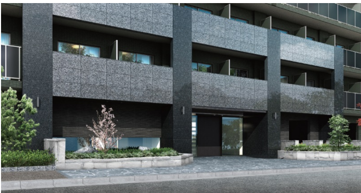
【エントランスイメージ】