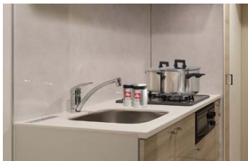
【システムキッチン】