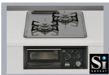
【Siセンサー付ガスコンロ】