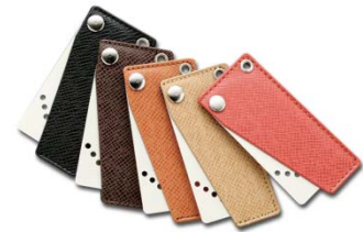
【カードキーイメージ】

・シャッター付ドアスコープをはじめ、防犯用のドアロック部分カバー、強固な耐久性のドアガードなど、玄関ドアのセキュリティ面にも配慮しました。