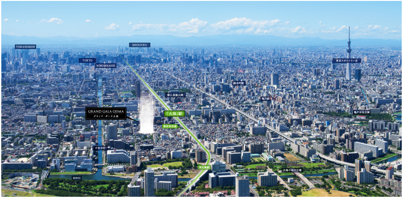
【現地周辺航空写真】