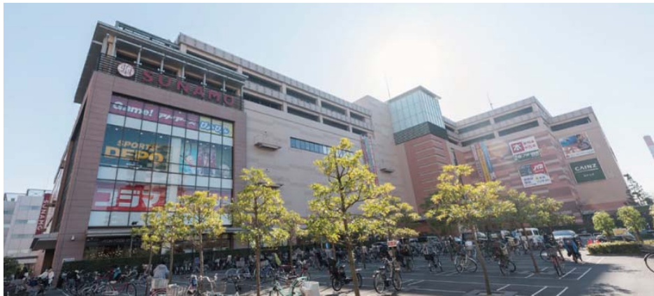
【イオン南砂町スナモ】