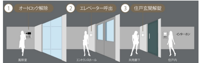
【オートロックシステム 概念図】