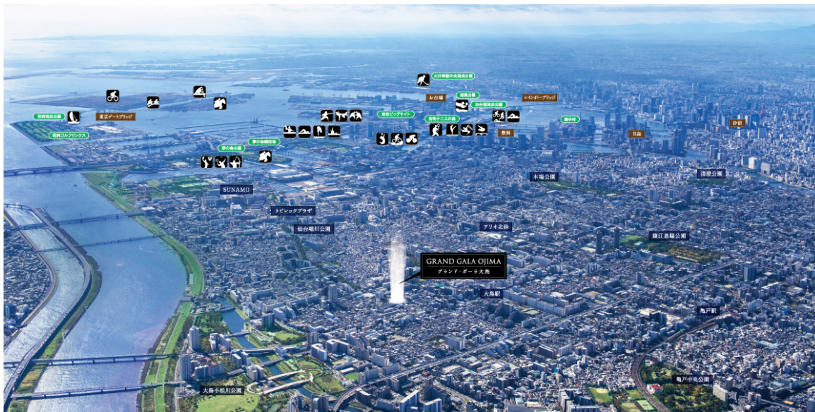
【湾岸エリア周辺航空写真】

近年、東京湾岸に広がる「豊洲」や「有明」などの湾岸エリアでは、数多くの再開発が行われ急速な進化を遂げてきました。また、東京8号線延伸計画やBRT計画などの新しい計画も予定されており、今後もさらなる発展が期待されています。そのような魅力溢れる湾岸エリアを生活圏内に「グランド・ガラ大島」は誕生します。