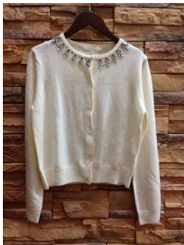
ANAYI カーディガン ¥3,980