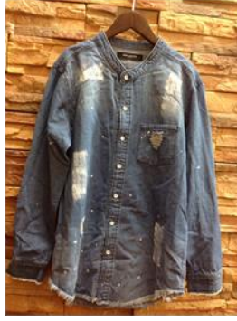
NANO UNIVERSE シャツ ¥2,980