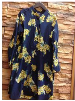
MACPHEE ワンピース ¥3,980