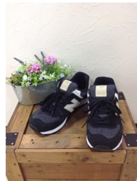
NEW BALANCE スニーカー ¥3,980