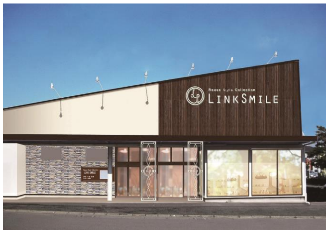
LINK SMILE 鎌倉台店 外観

日本最大級のリユースデパートを展開する株式会社コメ兵(以下「KOMEHYO」)は、2018年2月9日(金)に毎週金曜日に店内の商品が一斉値下げする新業態の店舗「LINK SMILE 鎌倉台店」をリニューアル OPEN いたします。店舗には買取ブースを新設し、宝石・貴金属、時計の買取も可能となります。