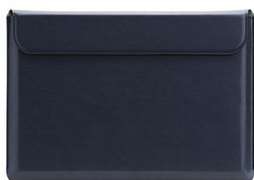
MacBook Pro 13" & 15" POUCH NAVY (ネイビー)