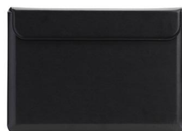
MacBook Pro 13" & 15" POUCH BLACK (ブラック)