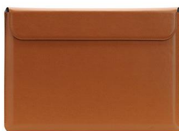
MacBook Pro 13" & 15" POUCH TAN (タン)