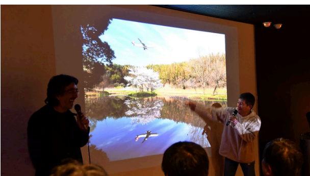
←過去のトークイベントの様子

開催日時 : 2017 年 12 月 8 日 (金) 18 : 30~ 開催会場 : 株式会社ヴァル研究所 1 階 イベントスペース イベントページ : https://event.ekiworld.net/