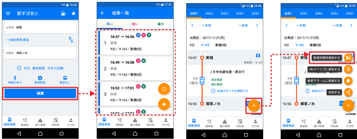
鉄道定期券の登録の画面イメージ

※「鉄道定期券」機能で登録可能な定期券は鉄道のみを利用したものに限りません。また、複数の定期券を登録することはできません。