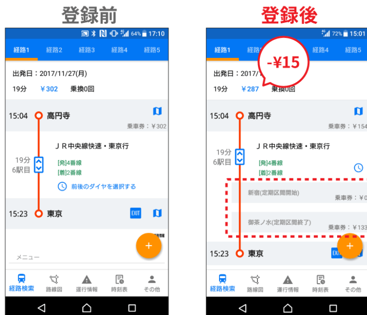
定期券区間を考慮した経路検索の画面イメージ

※経路中に定期券区間があった場合に運賃考慮する機能です。必ず定期券区間を通過する経路を表示するものではありません。