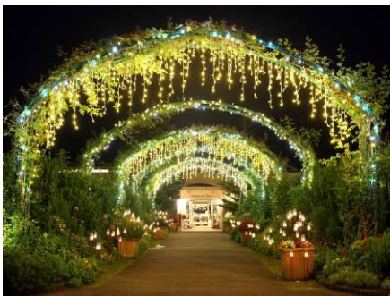
ガーデンミュージアム比叡