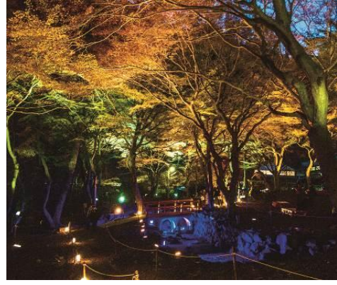
八瀬もみじの小径