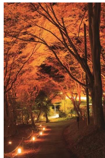
八瀬 もみじの小径