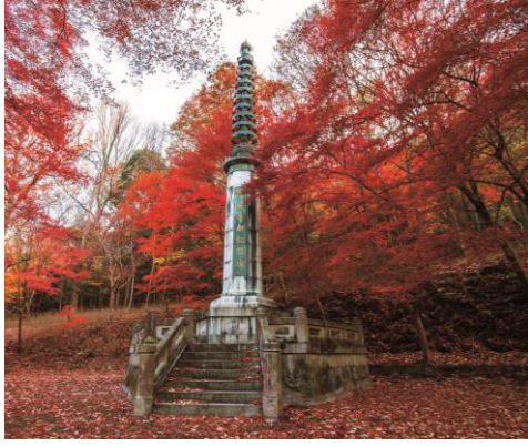
平安遷都千百年記念塔