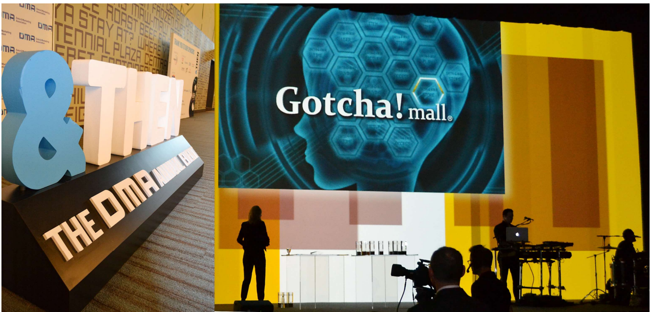
※写真：2017年10月8日にニューオーリンズで開催された DMA 国際エコー賞授賞式

世界最高峰のマーケティングアワードに位置付けられる DMA 国際エコー賞の「Retail and Direct Sales」部門にて、「小売のイノベーションを実現するプラットフォーム」であることが評価され、日本から唯一の受賞となりました。