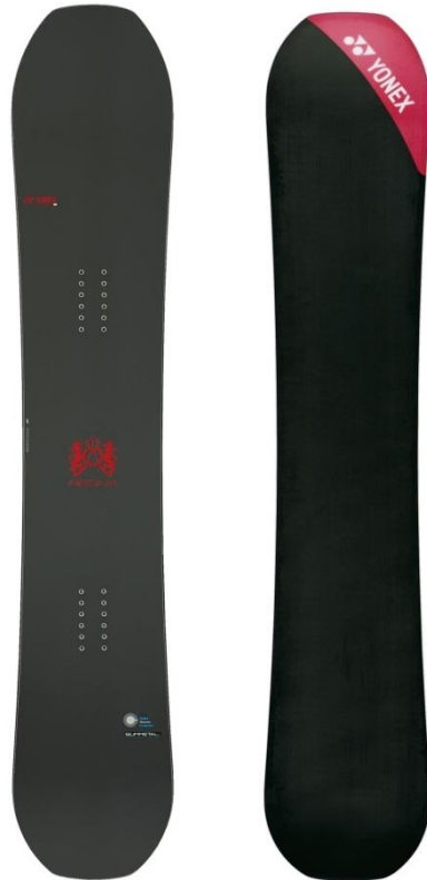
業界最軽量クラス 2090gの REGNA(レグナ)

ヨネックス株式会社(代表取締役社長:林田草樹)は、新型軽量コア構造「カーボンシェルドマイクロコア構造(CSMC)」を採用し、業界最軽量クラス 2090g ※ の実現と安定感のある乗り心地を両立したカーボンスノーボード「REGNA(レグナ)」を数量限定で好評発売中です。ヨネックスのカーボン技術を結集し、国内自社工場で匠の技と最新技術によって生み出されたハイエンドボードです。