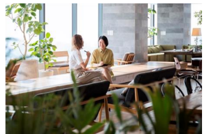
<アダストリア 新オフィスの様子>