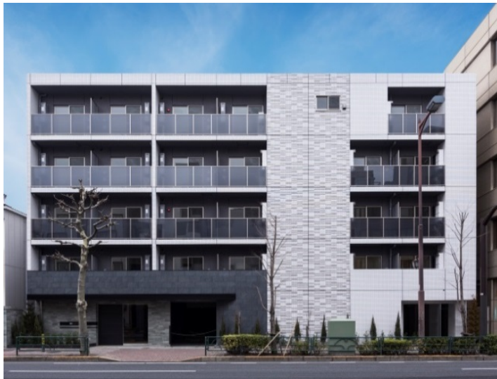
【ガーラ・ヴィスタ練馬】