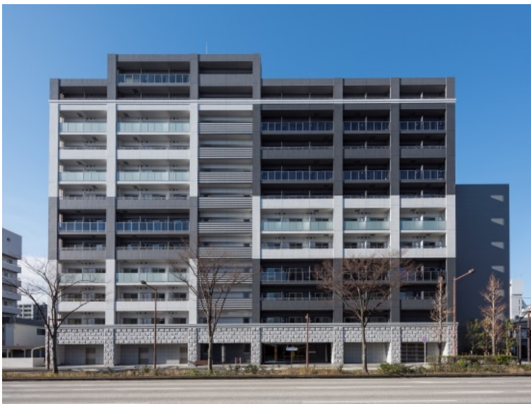
【ガーラ・プレシャス川崎】

当社は、今後も上質なデザインの外観やエントランス、安全性・快適性を重視した設備仕様など、居住者目線に立ったマンションの企画・開発を進めていきます。