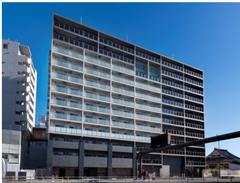
【グランド・ガーラ白金高輪】