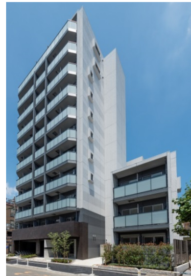
【ガーラ・プレシャス大井町】