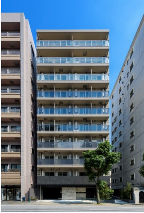
【ガーラ・プレシャス神宮外苑】