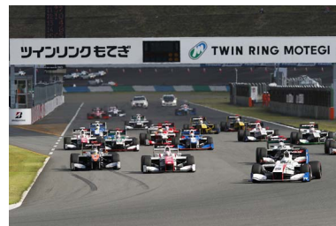
2016年ツインリンクもてぎ2&4レース スーパーフォーミュラ スタートシーン