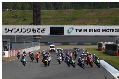
2016年スーパーバイクレース in もてぎ JSB1000クラス スタートシーン