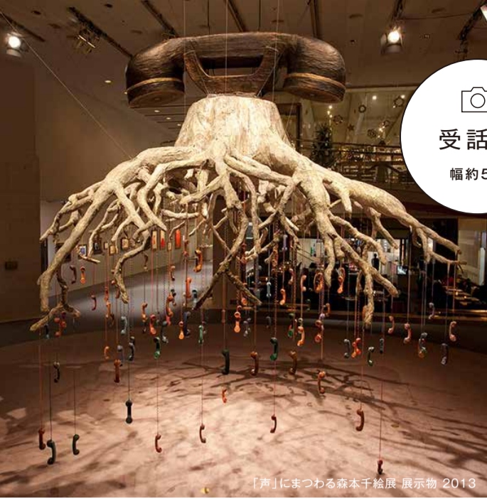
「声」にまつわる森本千絵展 展示物 2013