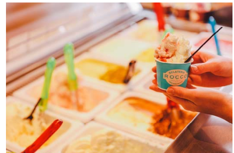
森のジェラテリア ROCCO