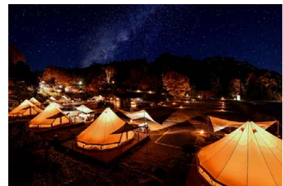
森と星空のキャンプヴィレッジ