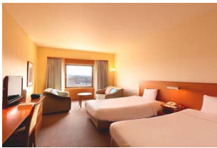
ホテルツインリンク

ゆったりとお過ごしいただける広々とした客室からは、ツインリンクもてぎの自然やレーシングコースを一望でき、夜には満天の星を眺められます。ホテル内には「のぞみの湯」や、栃木県、茂木町の美味しい食材を使った料理をお楽しみいただける「森のレストランMARCHERANT(マルシェラン)」があり、リゾートならではの贅沢なひとときをお過ごしいただけます。