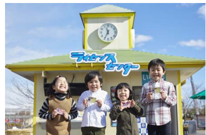
ライセンスセンター