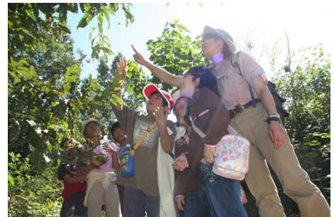
どんぐりの森 冒険指令書(イメージ)