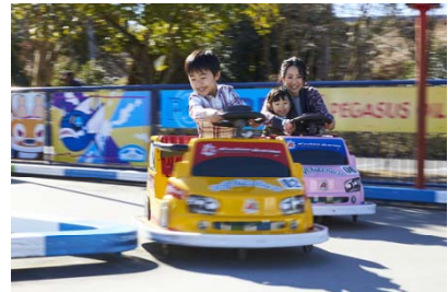
ドリフトキッズレーサー