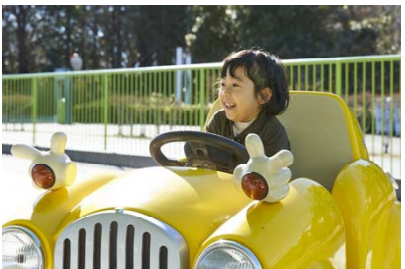
ピンキードライブ