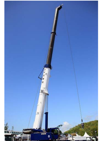
220tオールテレーンクレーン