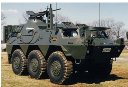
自衛隊 二式通信車

5月5日(金・祝)には「働くクルマスペシャルデー」を開催いたします。栃木県の警察・消防・自衛隊の協力により、パトカー、白バイ、消防車、自衛隊車両による迫力のパレード走行をはじめ、白バイ隊の一系乱れぬドリル走行や時速120kmのフォーメーションランなど、レーシングコースがあるツインリンクもてぎならではの迫力満点のパフォーマンスをお楽しみいただけます。また、オープニングセレモニーでは栃木県警音楽隊によるマーチングバンド演奏やパトカー、白バイ、消防車によるサイレンパフォーマンスなど、見るだけでなくサウンドもお楽しみいただけます。