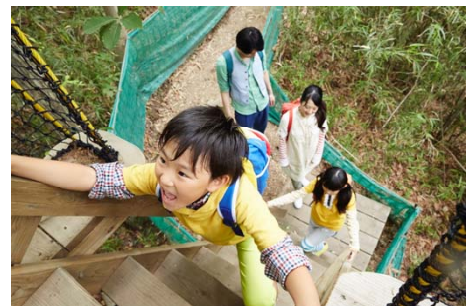
ウリンボ迷路(イメージ)