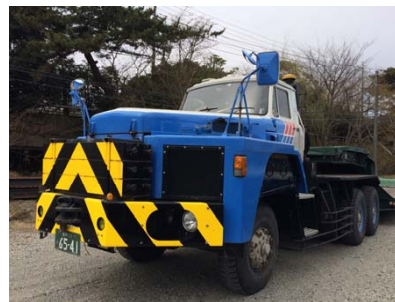
ボンネットトレーラー (70t積載低床トレーラー)