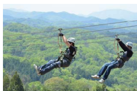
メガジップライン つばさ