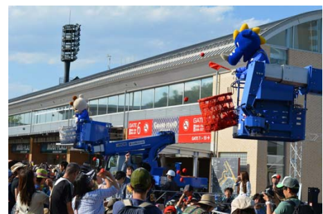
働くクルマと玉入れ

■時間：10:00～10:20 働くクルマとタイヤボウリング 11:00～11:20 働くクルマと綱引き 14:00～14:20 働くクルマデモンストレーション 15:30～15:50 働くクルマと玉入れ 16:30～16:50 働くクルマとタイヤボウリング