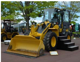
ホイールローダー

働くクルマの展示台数としては日本最大級となるイベント「働くクルマ大集合」を開催いたします。また、約60mの高さまで伸びるクレーン車「220tオールテレーンクレーン」、全長21mのボンネットトレーラー「70t積載低床トレーラー」といった、日本最大級の働くクルマも登場。他にも大型の働くクルマ、普段見ることのできない働くクルマ約100台※が勢揃い。このうちの約80台のクルマには、実際にお子様 が搭乗体験でき、家族みんなで見て、触って、乗って楽しんでいただけます。