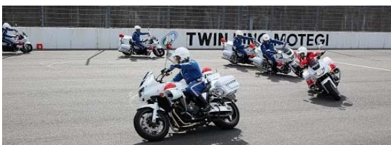
白バイ隊ドリル走行