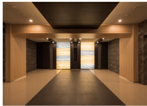
【エントランスホール】