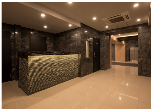
【フロントサービスカウンター】