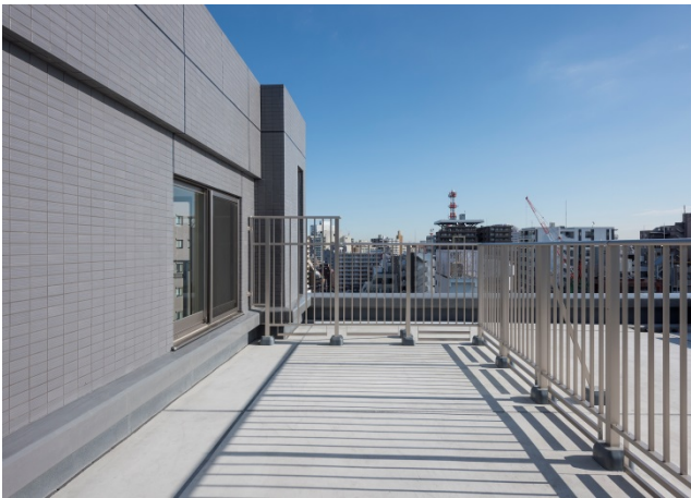
【12階 B1タイプ ルーフバルコニー】