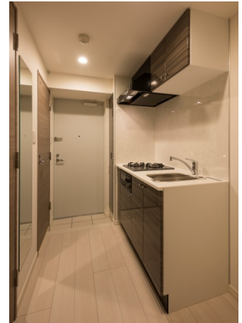
【A1タイプ 玄関・キッチン】