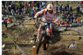
トライアル世界選手権