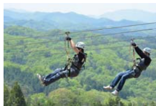
メガジップライン つばさ