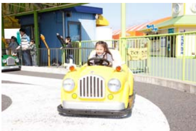
ピンキードライブ