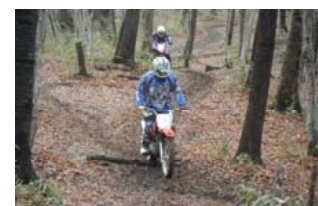
山道トレッキング