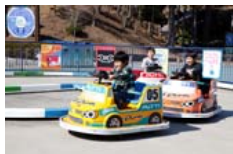
ドリフトキッズレーサー

大人観戦券をお持ちの方にモビパークパスポートを無料でプレゼント。さらには、子ども・幼児観戦券をお持ちの方は割引価格で販売いたします。新登場の「迷宮森殿 ITADAKI」をはじめ、最大15種類のアトラクションを思う存分、何度でも体験でき、ご家族でお得にツインリンクもてぎを満喫いただけます。