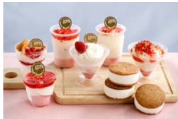
ジェラート マスモ(イメージ)

ジェラート マスモ：栃木県産のいちごやミルクなど地元の食材にこだわったジェラートが人気のお店 ドルチェ ミエーレ：約100年の歴史がある老舗、黒田養蜂園ならではの厳選されたハチミツを使ったジェラートは絶品