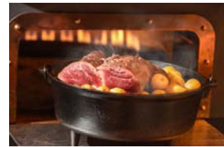
森のレストランMARCHERANT (イメージ)