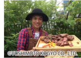
たけだバーベキュー