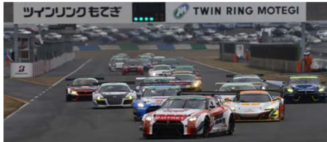
2016年スーパー耐久スタートシーン

4月1日(土)・2日(日) スーパー耐久開幕戦は、春のいただきまつりの期間中に開催します。