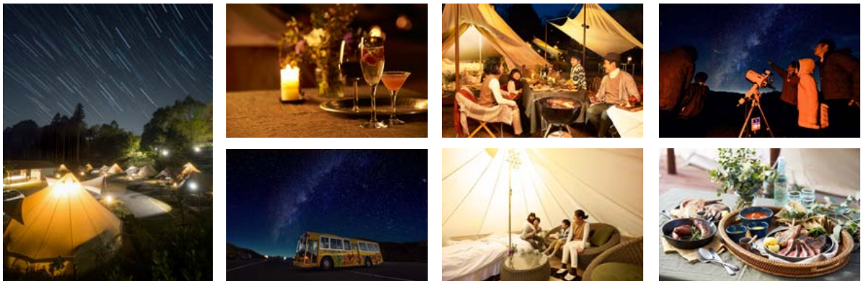
森と星空のキャンプヴィレッジ(イメージ)