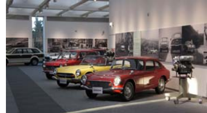
Honda Collection Hallの各フロア