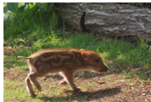
ハローウッズに生息する動物たち