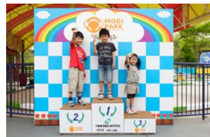
モビパーク内にある表彰台