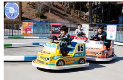
ドリフトキッズレーサー