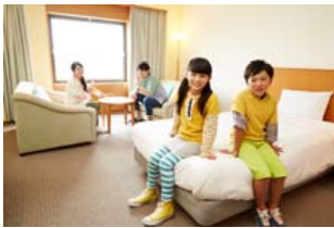
ホテルツインリンク(イメージ)

ゆったりとお過ごしいただける広々とした客室からは、ツインリンクもてぎの自然やレーシングコースを一望でき、夜には満天の星を眺められます。ホテル内には「のぞみの湯」や、地元栃木県産の美味しい食材を使った料理をお楽しみいただける「森のレストランMARCHERANT(マルシェラン)」があり、リゾートならではの贅沢なひとときをお過ごしいただけます