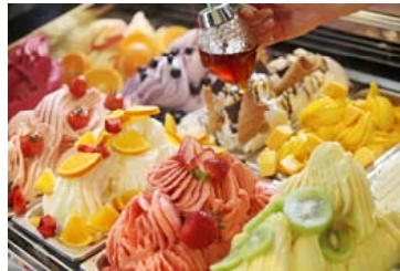
黒田養蜂園が手がける 「ドルチェ ミエーレ」(イメージ)