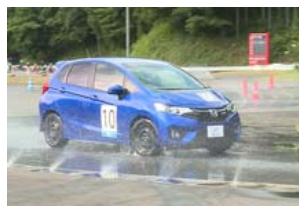
人工雪路走行体験