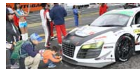
ファミリーグリッドウォーク

※各イベントの詳細はツインリンクもてぎホームページ( http://www.twinring.jp/ )をご覧ください。