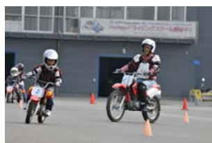
親子のバイク教室