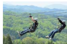
メガジップライン つばさ