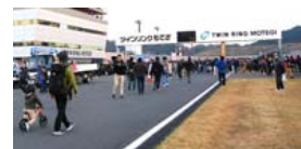
家族みんなでコースウォーク