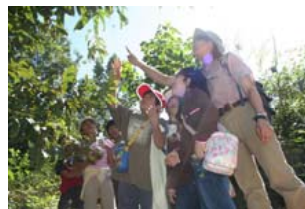
自然体験プログラム