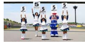
スタート直前！ドキドキのカウントダウンボードアップ！