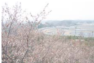
春のハローウッズ