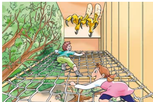
迷宮森殿 ITADAKI イメージ