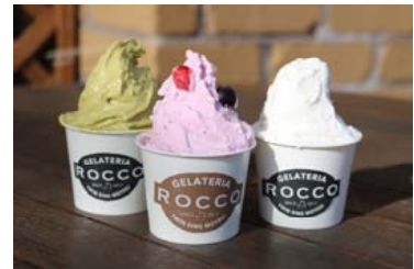
森のジェラテリア ROCCO (イメージ)