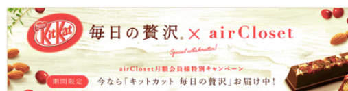
TOPページ掲載のバナー