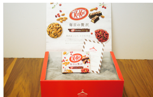
限定特別デザインBOX