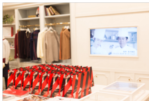
イベント当日の様子