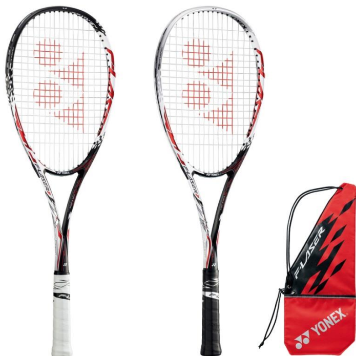
左から F-LASER 7S、F-LASER 7V、F-LASER 専用ケース